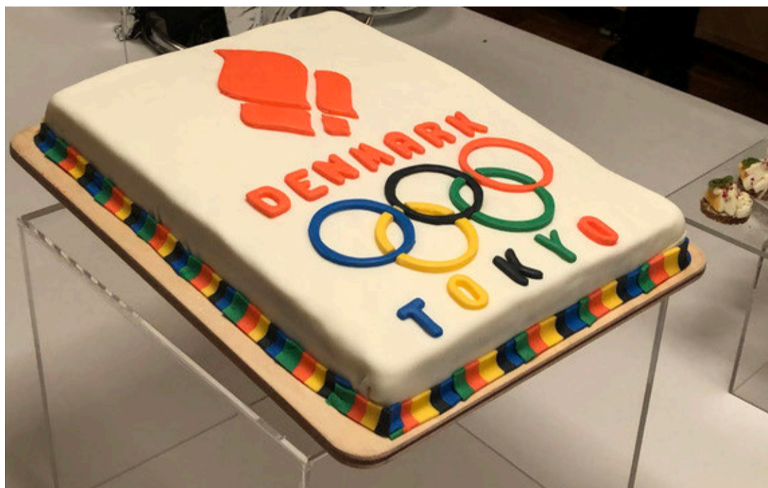
SØDE TIDER. På den danske ambassade i Tokyo blev der serveret OL-kage under Danmarks Idrætsforbunds studietur i februar. Alt tegnede lyst. Et par uder senere blev OL aflyst.